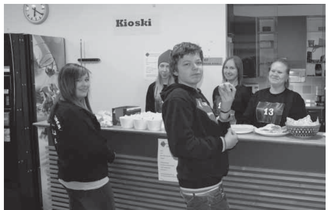
Hamiksen Cinema-kioskilla hammaslahtelaisia nuoria