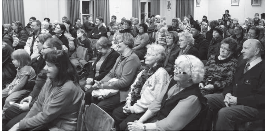
Hammaslahden Joulunavaus 29.11.2012 NS-talolla